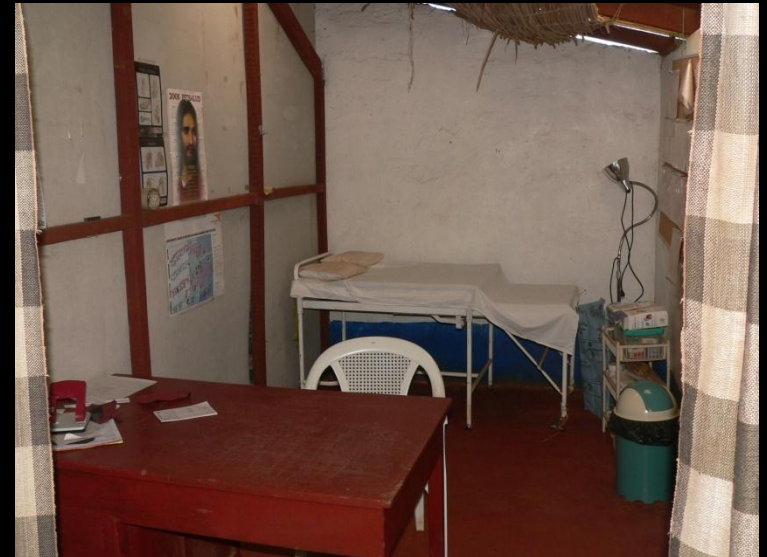
.- Atención a paciente enfermos agudos .- Atención al paciente crónico