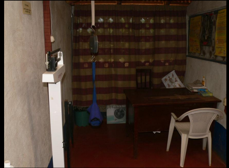
.- Control de niño sano.