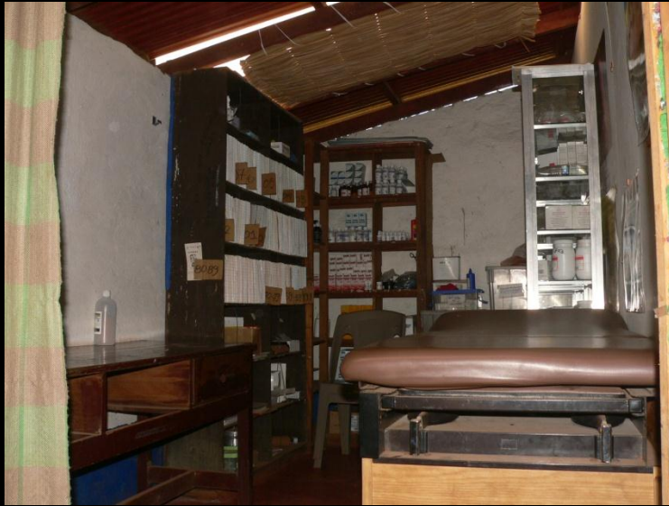
.- Control de embarazadas y neonatos